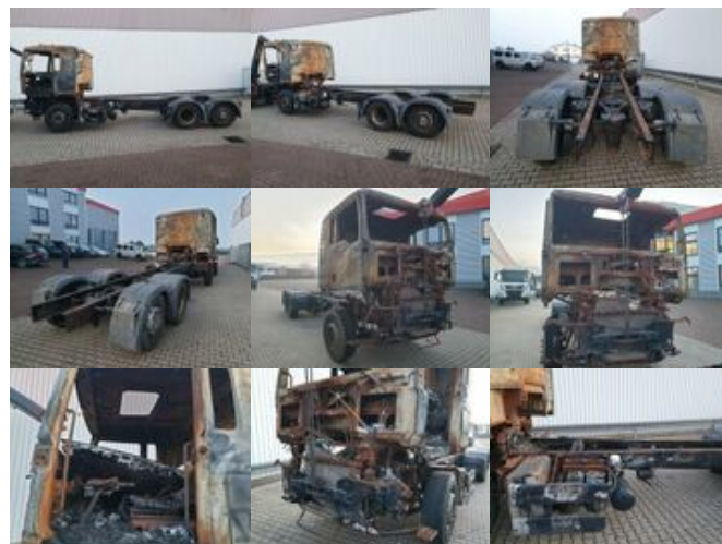
MAN TGA 26.440 6x2 BL Brandschaden TGA 26.440 6x2 BL Brandschaden

Preis (brutto): 5.831,00 € Gesetzl. MwSt. 19%: 931,00 €