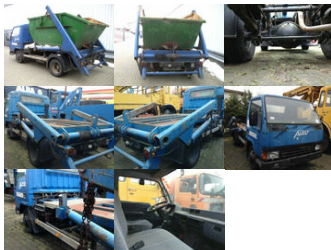
Mitsubishi Canter 4x2

Preis (brutto): 4.641,00 € Gesetzl. MwSt. 19%: 741,00 €