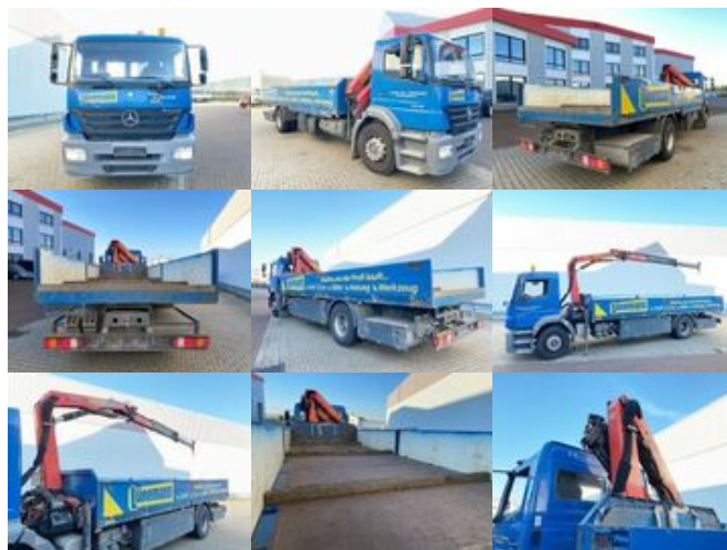
Mercedes-Benz Axor 1828 L 4x2 Axor 1828 L 4x2 mit Kran Palfinger PK 9501, Funk

Preis (brutto): 28.441,00 € Gesetzl. MwSt. 19%: 4.541,00 €