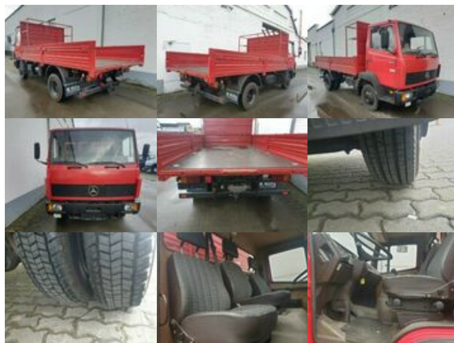
Mercedes-Benz 814 814 4x2, 6 Zylinder Top Zustand