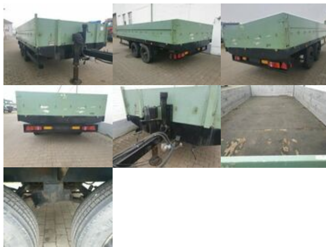
Obermaier ETN 65 Obermaier ETN 65 Tandempritsche

Preis (brutto): 4.641,00 € Gesetzl. MwSt. 19%: 741,00 €