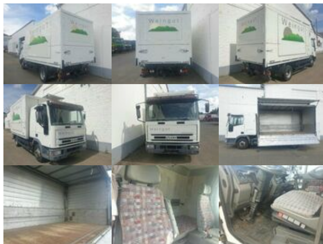
Iveco Euro Cargo ML 75E14 4x2 Euro Cargo ML 75E14 4x2 Getränkewagen, 6-Zylinder-Motor

Preis (brutto): 5.831,00 € Gesetzl. MwSt. 19%: 931,00 €