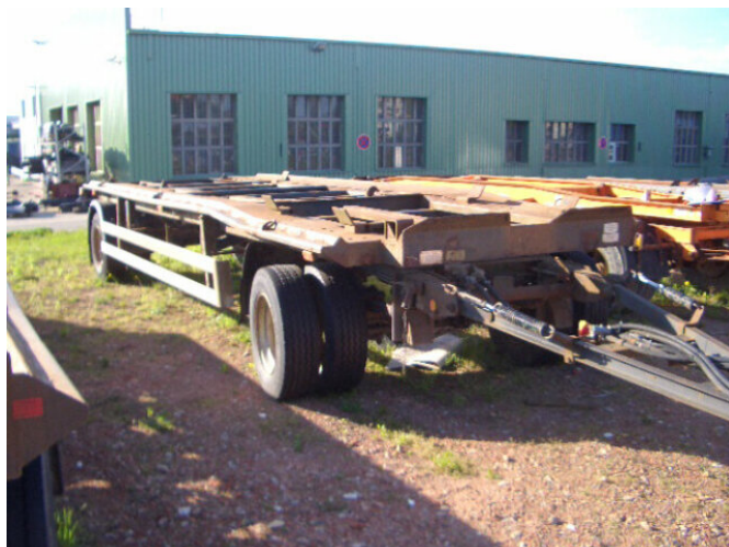
GEORG, NEIT. GLI 12-51KO Georg GLI 12-51 KO

Preis (brutto): 3.451,00 € Gesetzl. MwSt. 19%: 551,00 €