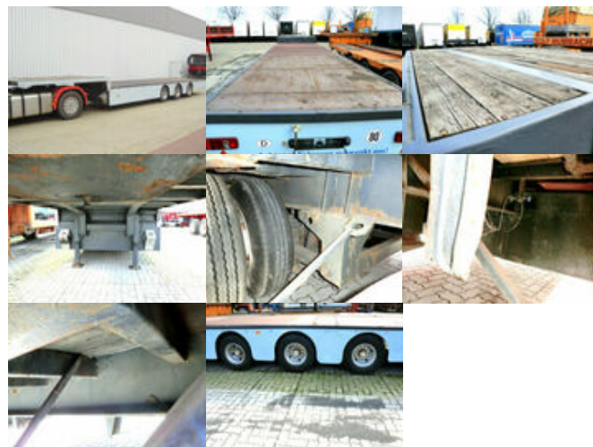
Zorzi SANh Plattform ZORZI (I) Tiefloader-Auflieger

Preis (brutto): 8.211,00 € Gesetzl. MwSt. 19%: 1.311,00 €