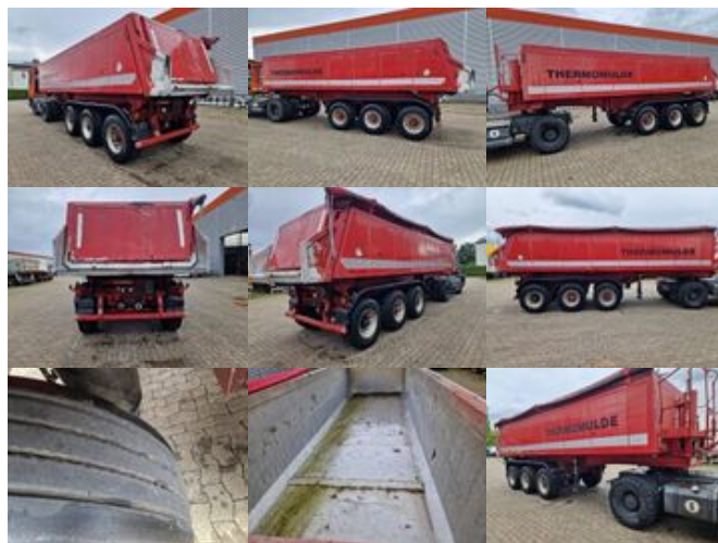
Meierling MSK 24 MSK 24 Voll-Alu Iso-Kastenmulde, ca. 25m 3 , 4x vorhanden

Preis (brutto): 11.781,00 € Gesetzl. MwSt. 19%: 1.881,00 €