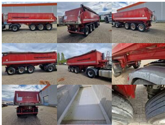
Meierling MSK 24 MSK 24 Voll-Alu Iso-Kastenmulde, ca. 25m 3 , 2x vorhanden

Preis (brutto): 11.781,00 € Gesetzl. MwSt. 19%: 1.881,00 €