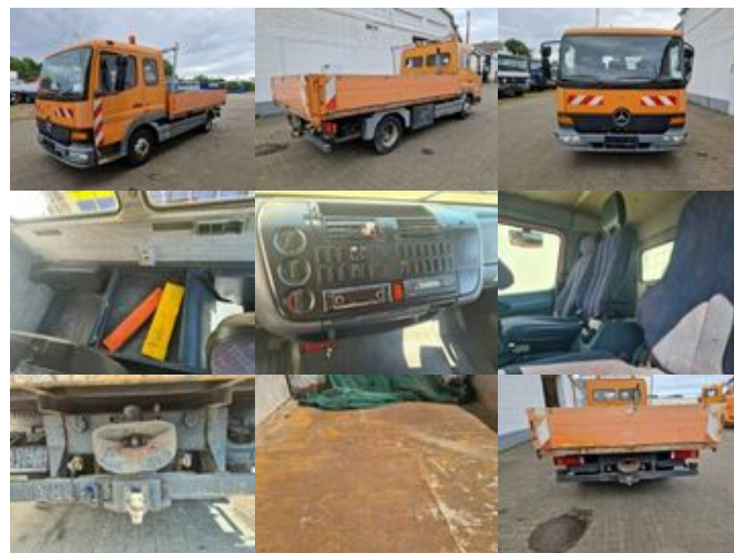
Mercedes-Benz Atego 815 4x2 Atego 815 4x2, 2x AHK