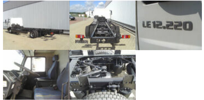
MAN LE 12.220 BL 4x2 LE 12.220 BL 4x2, Ersatzteilträger!

Preis (brutto): 4.641,00 € Gesetzl. MwSt. 19%: 741,00 €