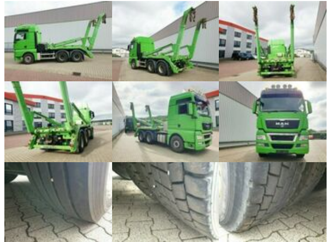
MAN TGX 26.540 6x4 BB TGX 26.540 6x4 BB, Intarder, XXL-Fahrerhaus

Preis (brutto): 35.581,00 € Gesetzl. MwSt. 19%: 5.681,00 €