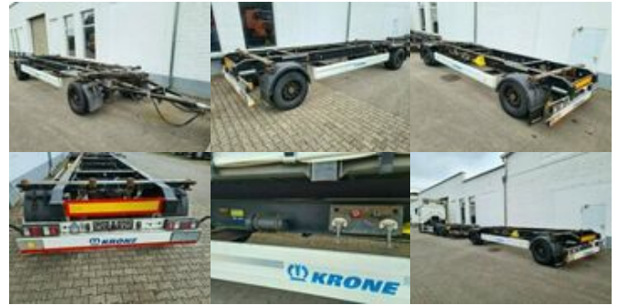
Krone AZW AZW 18, BDF