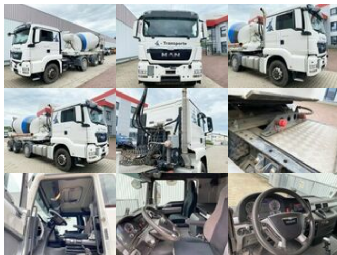
MAN TGS 18.400 4x4H BLS TGS 18.400 4x4H BLS, HydroDrive, Motorantrieb

Preis (brutto): 29.631,00 € Gesetzl. MwSt. 19%: 4.731,00 €