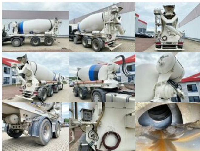
HOENKHAUS 10/5/F/ZA-1800 KARRENA Betonmischer ca. 10m 3 10/5/F/ZA-1800 KARRENA Betonmischer ca. 10m 3 , Liftachse

Preis (brutto): 18.921,00 € Gesetzl. MwSt. 19%: 3.021,00 €