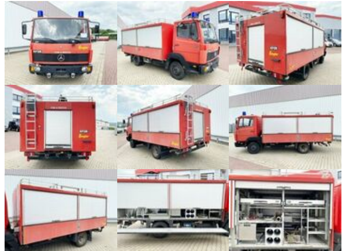
Mercedes-Benz LK 814 F 4x2 LK 814 F 4x2, Ziegler RW1, 6-Zylinder Motor

Preis (brutto): 15.351,00 € Gesetzl. MwSt. 19%: 2.451,00 €