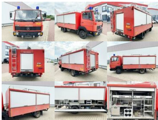
Mercedes-Benz LK 814 F 4x2 LK 814 F 4x2, Ziegler RW1, 6-Zylinder Motor

Preis (brutto): 15.351,00 € Gesetzl. MwSt. 19%: 2.451,00 €