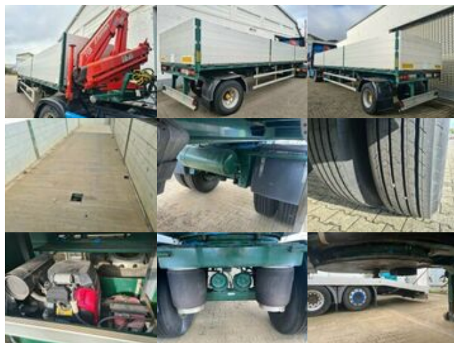
Sonstige Hersteller SCHELLING 504 H 22 SCHELLING 504 H 22 mit Kran Ferrari 708, 7m/t

Preis (brutto): 14.161,00 € Gesetzl. MwSt. 19%: 2.261,00 €