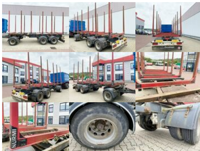
- ZASLAW D-36657 Holzanhänger ZASLAW D-36657 Holzanhänger

Preis (brutto): 9.401,00 € Gesetzl. MwSt. 19%: 1.501,00 €