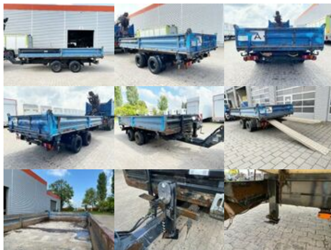
Blomenröhr Kippanhänger Kippanhänger