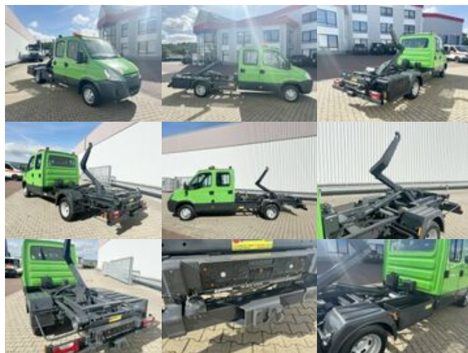
Iveco Daily 45C15D 4x2 Doka Daily 45C15D 4x2 Doka, City-Abroller

Preis (brutto): 20.111,00 € Gesetzl. MwSt. 19%: 3.211,00 €