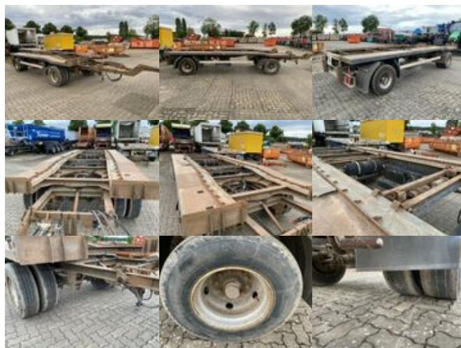
Schmidt FT 18/Z/5,4 Abrollanhänger FT 18/Z/5,4 Abrollanhänger

Preis (brutto): 3.451,00 € Gesetzl. MwSt. 19%: 551,00 €