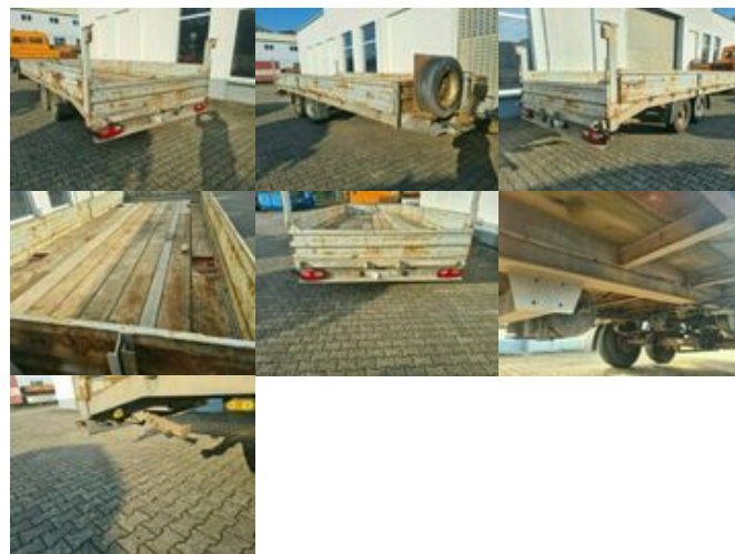
MOESLEIN Möslein Tandem TT 105 Möslein Tandemtieflader TT 105

Preis (brutto): 5.831,00 € Gesetzl. MwSt. 19%: 931,00 €