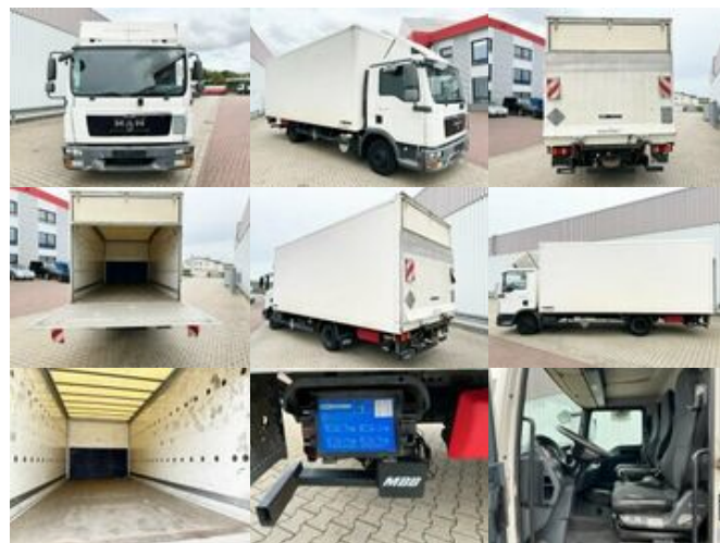
MAN TGL 8.180 4x2 BL TGL 8.180 4x2 BL mit MBB LBW

Preis (brutto): 9.401,00 € Gesetzl. MwSt. 19%: 1.501,00 €