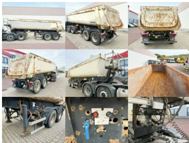
Schmitz SKI 18 SL 7.2 SKI 18 SL 7.2, Liftachse, Stahlmulde ca. 24m 3

Preis (brutto): 8.925,00 € Gesetzl. MwSt. 19%: 1.425,00 €