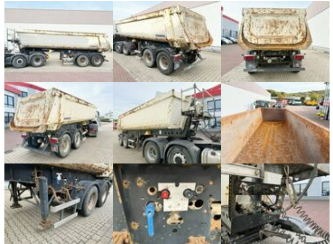
Schmitz SKI 18 SL 7.2 SKI 18 SL 7.2, Liftachse, Stahmulde ca. 24m 3

Preis (brutto): 8.925,00 € Gesetzl. MwSt. 19%: 1.425,00 €