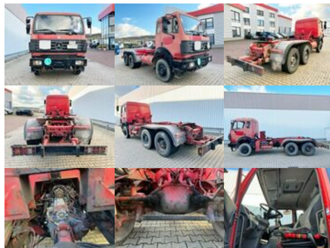
Mercedes-Benz SK II 25/2634 K 6x4 SK II 25/2634 K 6x4

Preis (brutto): 26.061,00 € Gesetzl. MwSt. 19%: 4.161,00 €