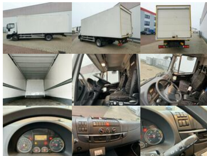
Iveco EuroCargo ML140E28 4x2 EuroCargo ML140E28 4x2, 41 cbm

Preis (brutto): 27.251,00 € Gesetzl. MwSt. 19%: 4.351,00 €