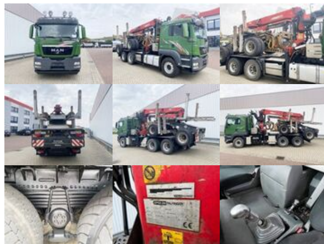
MAN TGS 26.480 6x4 BB TGS 26.480 6x4 BB, Intarder, Kran Epsilon S270L88, Langholz

Preis (brutto): 38.080,00 € Gesetzl. MwSt. 19%: 6.080,00 €