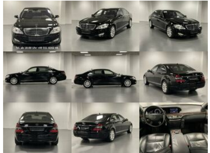
Mercedes-Benz S 420 L CDI Limousine BKA Ausstattung 420 L CDI Limousine BKA Ausstattung

Preis: 27.000,00 € MwSt. nicht ausweisbar