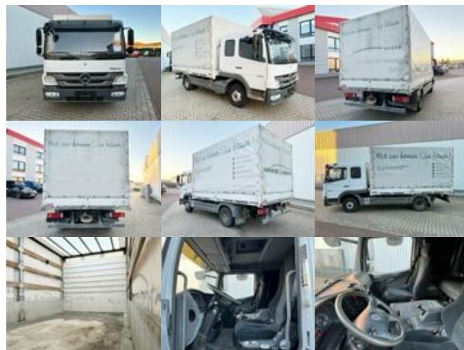
Mercedes-Benz Atego 822 4x2 Atego 822 4x2, Doka mit Kombisitzbank

Preis (brutto): 20.230,00 € Gesetzl. MwSt. 19%: 3.230,00 €