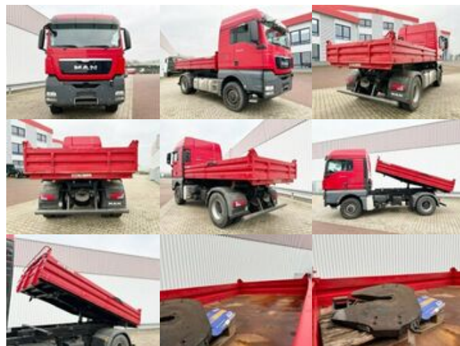
MAN TGX 18.440 4x4H BL TGX 18.440 4x4H BL, HydroDrive, SZM/Kipper

Preis (brutto): 39.151,00 € Gesetzl. MwSt. 19%: 6.251,00 €