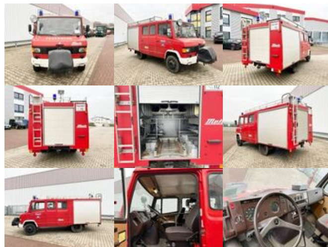
Mercedes-Benz 709 D 4x2 Doka 709 D 4x2 Doka, LF 8

Preis: 9.900,00 € MwSt. nicht ausweisbar