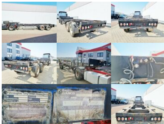
Tang Pritschenaufleger TANG Pritschenaufleger

Preis (brutto): 4.641,00 € Gesetzl. MwSt. 19%: 741,00 €