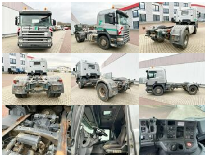
Scania 124G 420 4x2 124G 420 4x2, Retarder