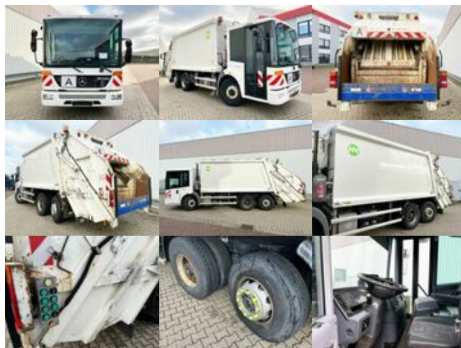
Mercedes-Benz Econic 2633 L/NLA 6x2/4 Econic 2633 L/NLA 6x2/4, Lenkachse, Sperrmüllwagen ca. 23,9m 3

Preis (brutto): 15.470,00 € Gesetzl. MwSt. 19%: 2.470,00 €