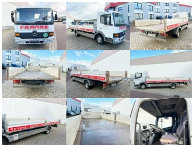
Mercedes-Benz Atego 818 4x2 Atego 818 4x2

Preis (brutto): 7.021,00 € Gesetzl. MwSt. 19%: 1.121,00 €