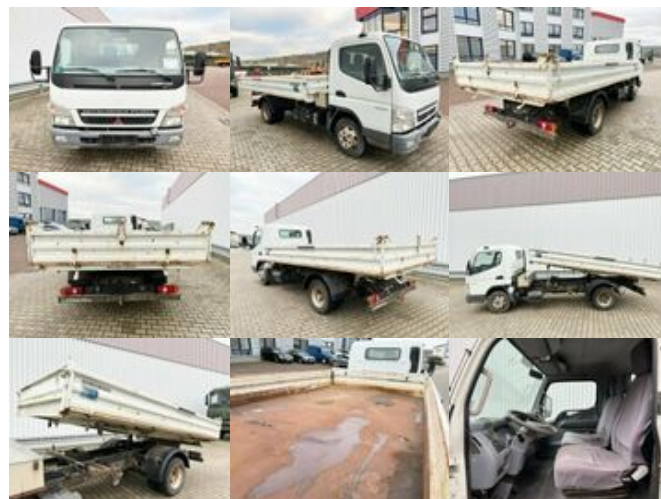
Mitsubishi Canter Fuso 7C15D 4x2 Canter Fuso 7C15D 4x2

Preis (brutto): 14.161,00 € Gesetzl. MwSt. 19%: 2.261,00 €