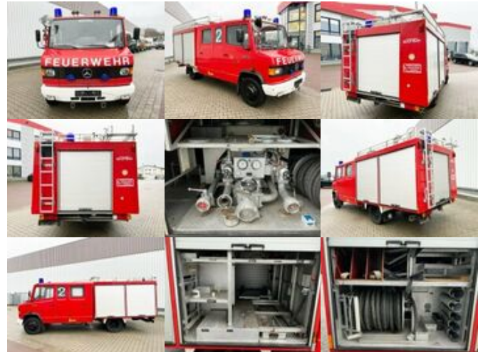
Mercedes-Benz 814 D 4x2 Doka, TLF 8 814 D 4x2 Doka, TLF 8

Preis: 14.900,00 € MwSt. nicht ausweisbar