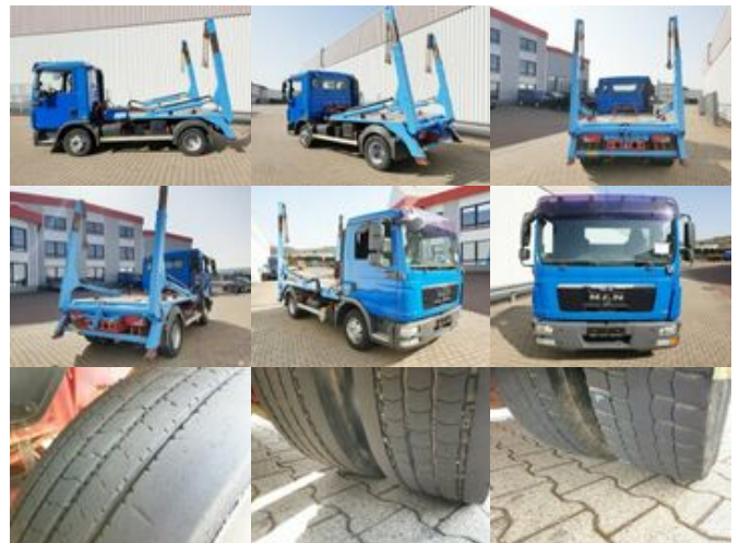
MAN TGL 8.180 4X2 BL TGL 8.180 4X2 BL, EEV

Preis (brutto): 21.301,00 € Gesetzl. MwSt. 19%: 3.401,00 €