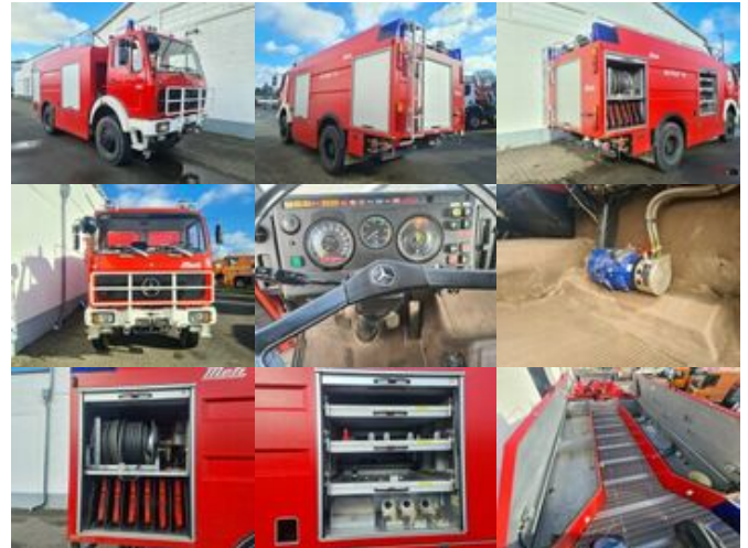
Mercedes-Benz NG 1719 AF 4x4, TLF 24/50 NG 1719 AF 4x4, TLF 24/50

Preis: 27.900,00 € MwSt. nicht ausweisbar