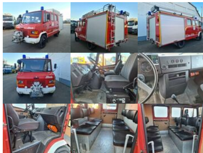
Mercedes-Benz 709 D 4x2 Doka 709 D 4x2 Doka, LF 8

Preis: 11.900,00 € MwSt. nicht ausweisbar