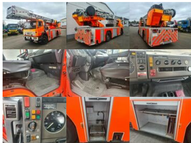
Mercedes-Benz 1524 DL 23-12 Drehleiter Feuerwehr 1524/4x2 DL 23-12 Drehleiter Feuerwehr

Preis: 21.900,00 € MwSt. nicht ausweisbar