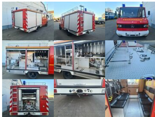
Mercedes-Benz 814 D 4x2 Doka 814 D 4x2 Doka, LF 8/6

Preis: 15.900,00 € MwSt. nicht ausweisbar