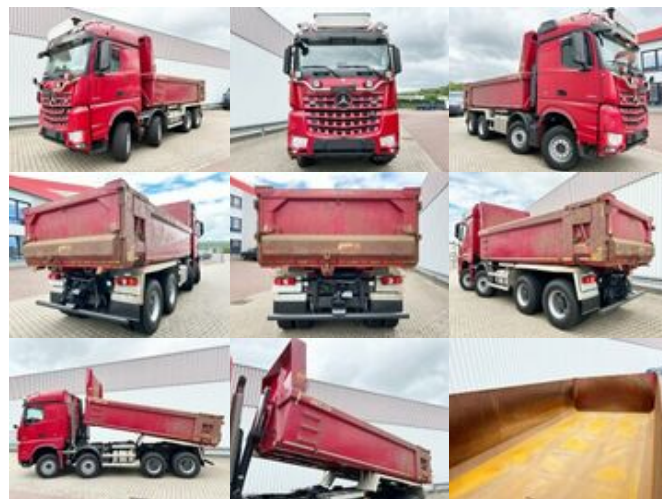
Mercedes-Benz Arocs 3263 8x4/4 Arocs 3263 8x4/4, Retarder, Stahlmulde ca.14m 3 , Hydr. Heckklappe

Preis (brutto): 77.231,00 € Gesetzl. MwSt. 19%: 12.331,00 €