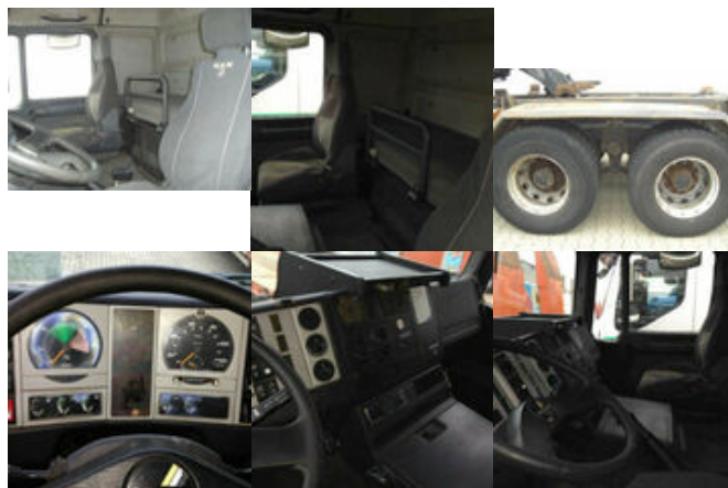
MAN T39 26.364 6x4

Preis (brutto): 14.161,00 € Gesetzl. MwSt. 19%: 2.261,00 €