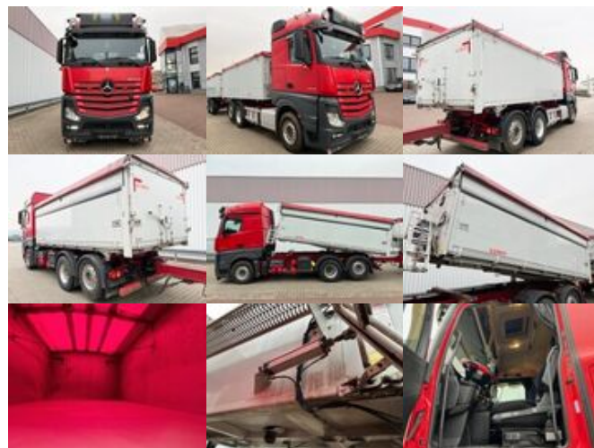
Mercedes-Benz Actros 2548 L 6x2 Actros 2548 L 6x2, Retarder, Liftachse, StreamSpace, 2-Seiten-Getreidekipper