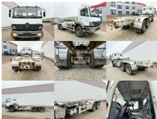
Mercedes-Benz Atego 2628 K 6x4 Atego 2628 K 6x4, 6-Zylinder

Preis (brutto): 23.681,00 € Gesetzl. MwSt. 19%: 3.781,00 €