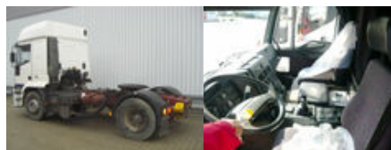
Iveco Euro Tech 440ET38 4x2 Euro Tech 440ET38 4x2, Kipphydraulik

Preis (brutto): 6.844,00 € Gesetzl. MwSt. 16%: 944,00 €