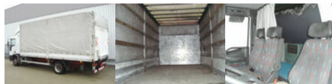
Iveco EuroCargo 120E24 4x2

Preis (brutto): 8.211,00 € Gesetzl. MwSt. 19%: 1.311,00 €