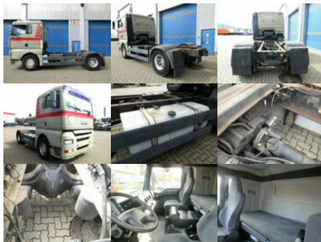
MAN TGA 18.360 4x2

Preis (brutto): 9.401,00 € Gesetzl. MwSt. 19%: 1.501,00 €